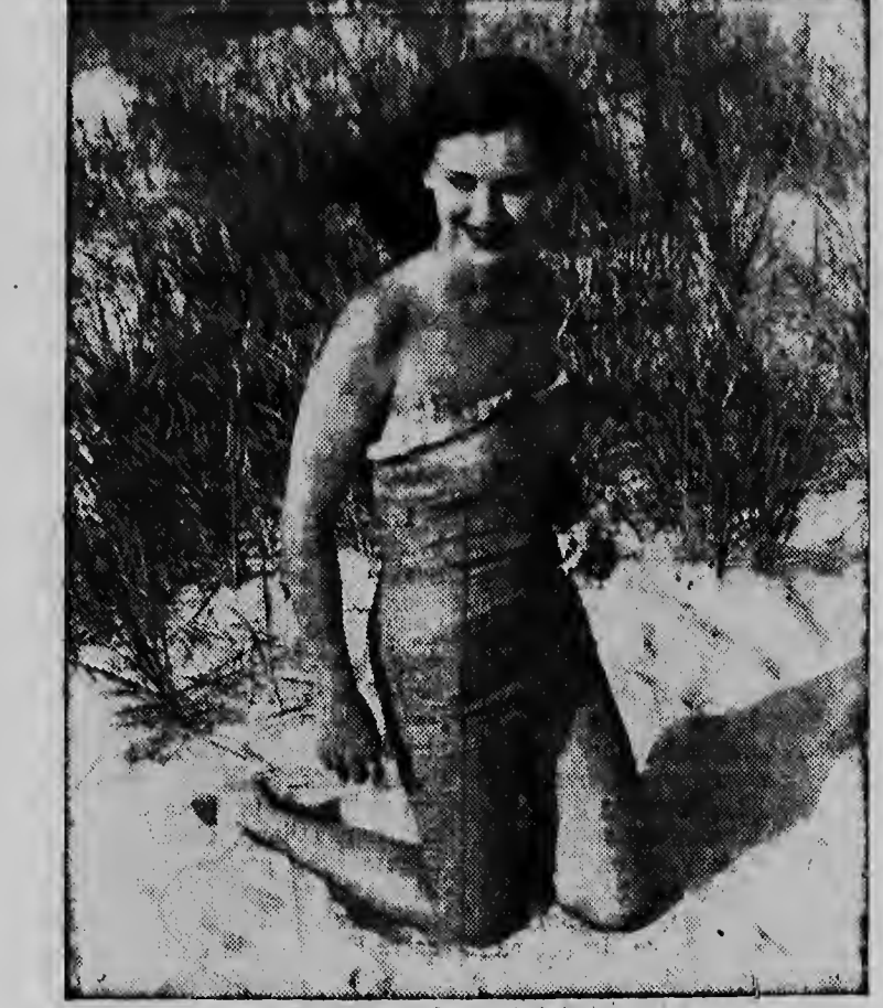
Naturalmente cu nu beach no por ta difícil saca portret